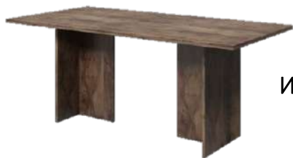
Стол переговоров L-101